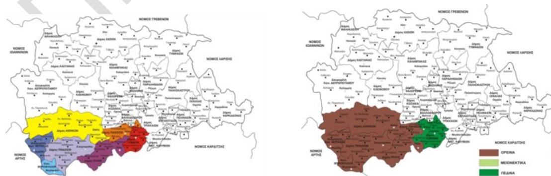
Εικόνα 1: Η περιοχή της έρευνας

Η μελέτη της θερμοκοιτίδας αναφέρεται στο Δήμο Πύλης, Περιφερειακής Ενότητας Τρικάλων, στην Περιφέρεια Θεσσαλίας και πιο συγκεκριμένα στις ορεινές περιοχές του Δήμου. Ο δήμος Πύλης καταλαμβάνει μια «γεωγραφική ζώνη» στο νοτιοδυτικό μέρος της Περιφερειακής Ενότητας Τρικάλων. Περιλαμβάνει ορεινά και πεδινά (δυναμικά) τοπικά διαμερίσματα, σύμφωνα με την Οδηγία 75/268/ΕΟΚ. Συνολικά περιλαμβάνει 43 από το σύνολο των 146 τοπικών και κοινοτικών διαμερισμάτων της Π.Ε.. Τρικάλων. Από τα 43 τα 33 χαρακτηρίζονται ως ορεινά (87,38%) και τα 10 ως δυναμικά (πεδινά).